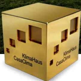
Casa Riga, Comano Terme, TN. Vincitore CasaClima Award 2016

Il cubo d'oro premia progettisti e committenti che interpretano l'edilizia energeticamente efficiente e sostenibile in modo particolarmente riuscito e innovativo. I vincitori rappresentano il denominatore comune tra un basso consumo energetico, un clima interno salubre e confortevole e un buon bilancio ecologico, le esigenze di libertà progettuali e costruttiva dei committenti, a prescindere dallo stile architettonico, dalle tecnologie costruttive e dai materiali utilizzati.