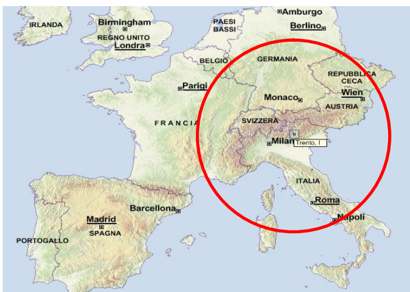
Figura 1: esempio di raggio di 500 Miglia dal progetto (es: a Trento)